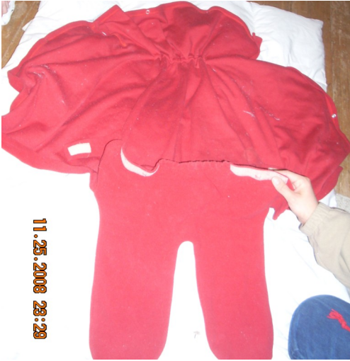
Einwickeldecke offen hinlegen