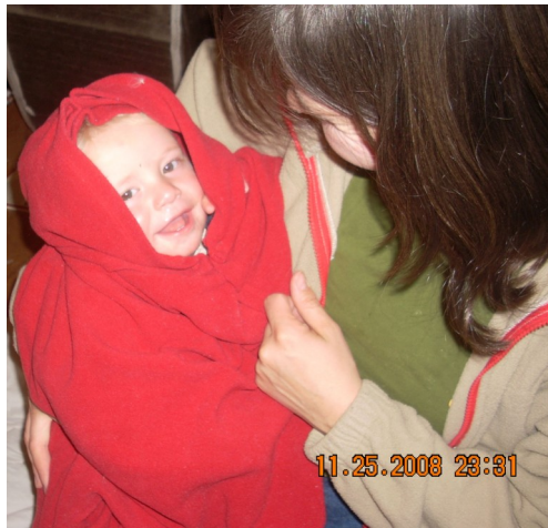
Gut eingepackt und warm kann ihr Kind jetzt in das Tuch, Komfortrage, Kinderwagen, oder Autositze.