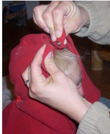
Kopfteil ueber den Kopf heben und Druckknopf schliessen