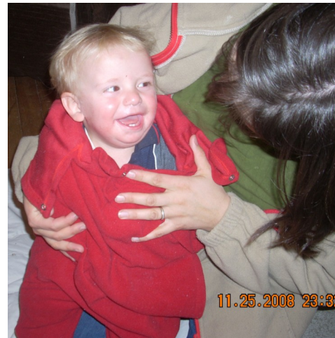
Das Kopfteil kann auch heruntergefaltet werden, je nachdem wie das Wetter ist.