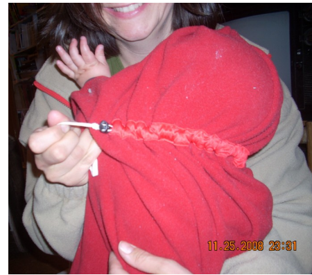
Nackbereich mit dem elastischem Kordelzug verstellen